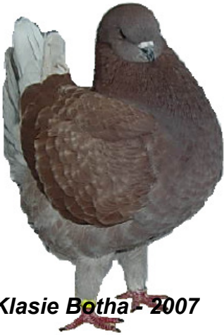
Klasie Botha - 2007