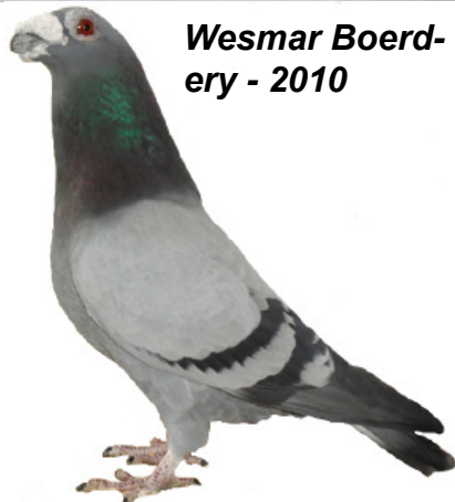
Wesmar Boerdery - 2010