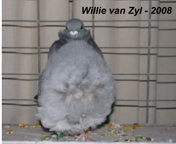
Willie van Zyl - 2008