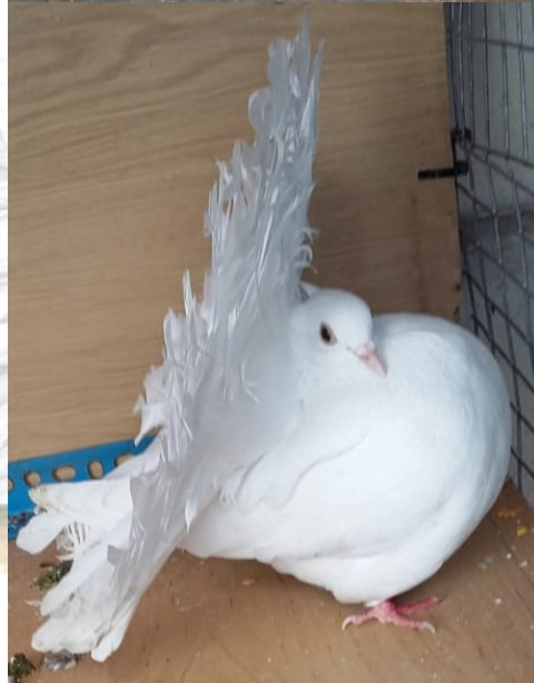
Nog twee nuwelinge wat ons van die Fantail Prestigeskou af saam gebring het