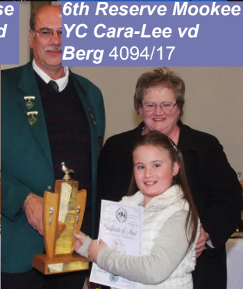
KwaZulu Natal Region winners of the Bertie Wessels Trophy