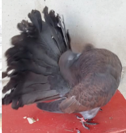
My eerste twee babas wat ek self geteel het

en soos ek begin skryf het, het my vrou my geterg dit is my duiwe CV. Ek het toe oom Nico na omtrent 2 weke oorreed om aan my een paar te verkoop, ek het toe gesukkel met transport, gelukkig het oom