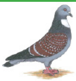
The Fancy Pigeon

National Editor - E-mail: cora.christo@gmail.com - Cell: 076 391 5800