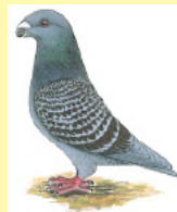
The Fancy Pigeon