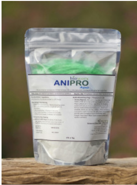
bioworx ANIPRO Aqua - 25 x 5g R117.34

Lourens Muller. Die Duiwehoekie. 29/01/2017