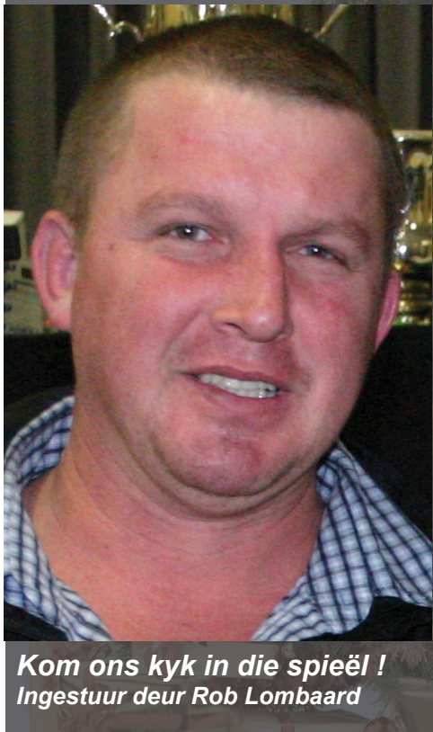
Kom ons kyk in die spieël ! Ingestuur deur Rob Lombaard

Ek self maak myself skuldig aan juis van die punte wat genoem word. Somtyds per toeval en ander tye met 'n plan in gedagte. Daar is tye wat ek negatiewe punte uitlig en onder ons bestuur se aandag probeer bring om gesprek uit te lok. Ek kan ook sê dat baie lede net terug sit en absoluut niks doen nie, party lede is dalk bang om 'n negatiewe vraag te vra en heel gereeld vir een of ander rede word die tipe vrae deur lede aan my gevra.