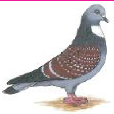
The Fancy Pigeon