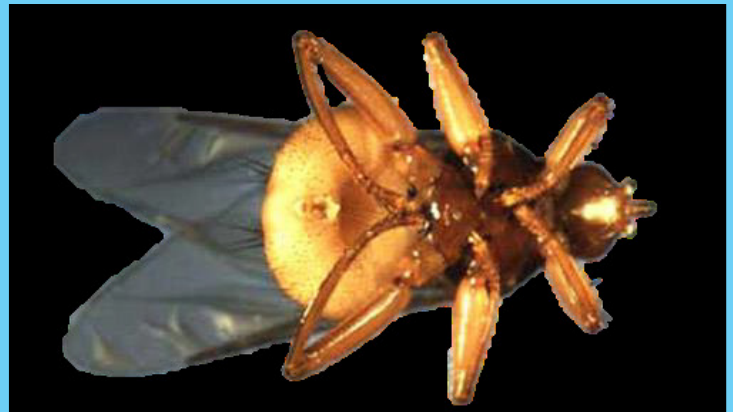
Figure 2. Ventral view of an adult female pigeon louse fly, Pseudolychia canariensis (Macquart).

Louse flies have a very interesting reproductive strategy. The female produces one larva at a time and retains the developing larva in her body until it is ready to pupate. The larva feeds on the secretions of a “milk gland” in the uterus of its mother. After three larval instars, the larva has reached its maximum size, the mother gives birth to the white pre-pupa which immediately begins to darken and form the puparium or pupal shell. The pupa of the pigeon louse fly looks like a dark brown, egg-shaped seed. The pupa is found in the nest of the host or on ledges where the birds roost. When the fly has completed its metamorphosis, the winged adult emerges from the puparium and flies in