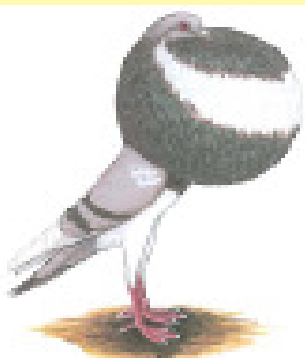
The Fancy Pigeon

E-pos: hennie@bioworx.co.za Webwerf: www.bioworx-pigeon.co.za