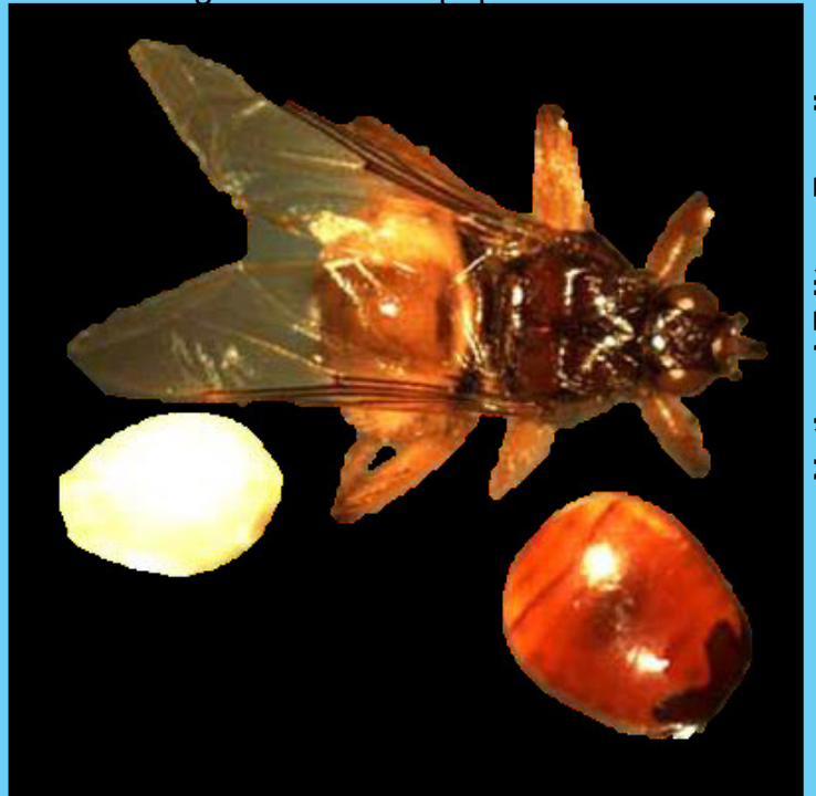
Figure 3. White pre-pupa (terminal larval instar which has stopped feeding and immediately begins to form the puparium when it is delivered by the mother), brown pupa and an adult pigeon louse fly, Pseudolychia canariensis (Macquart).

Louse flies have a very interesting reproductive strategy. The female produces one larva at a time and retains the developing larva in her body until it is ready to pupate. The larva feeds on the secretions of a “milk gland” in the uterus of its mother. After three larval instars, the larva has reached its maximum size, the mother gives birth to the white pre-pupa which immediately begins to darken and form the puparium or pupal shell. The pupa of the pigeon louse fly looks like a dark brown, egg-shaped seed. The pupa is found in the nest of the host or on ledges where the birds roost. When the fly has completed its metamorphosis, the winged adult emerges from the puparium and flies in