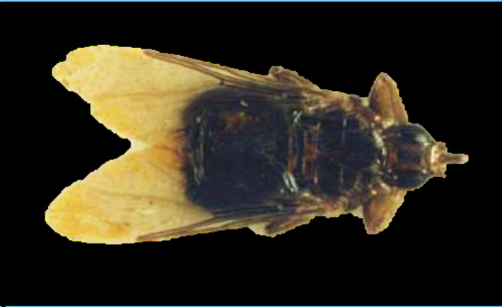
Dorsal view of an adult female pigeon louse fly, Pseudolychia canariensis (Macquart).

The pigeon louse fly, (Macquart), is a common ectoparasite of pigeons and doves. The louse flies (Hippoboscidae) are obligate blood-feeding ectoparasites of birds and mammals. Both adult males and females feed on the blood of their host. They are adapted for clinging to and moving through the plumage and pelage of their hosts. Strongly specialized claws help them cling to the hair or feathers of their particular host species. Pigeon flies retain their wings for their entire adult life. Others species are wingless (like sheep keds) or lose their wings once the newly emerged adults find a host (deer keds).