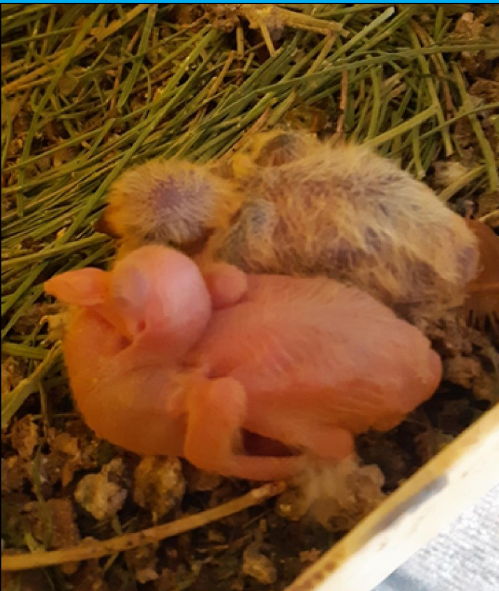
The Fancy Pigeon

Soos dr W. Hollander voorspel het in die laat 60s, het hulle 'n nuwe "uitersteverdunde mutant" op die d-lokus gevind. En soos hy voorspel het, veroorsaak dit 'n fenotipe wat, ten minste die eerste paar weke van sy lewe, so pigmentloos is dat dit byna wit is met pienk oë.