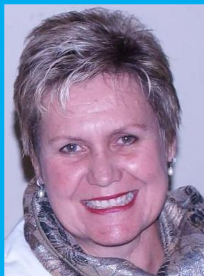
Van duiweboer se vrou tot duiweboer