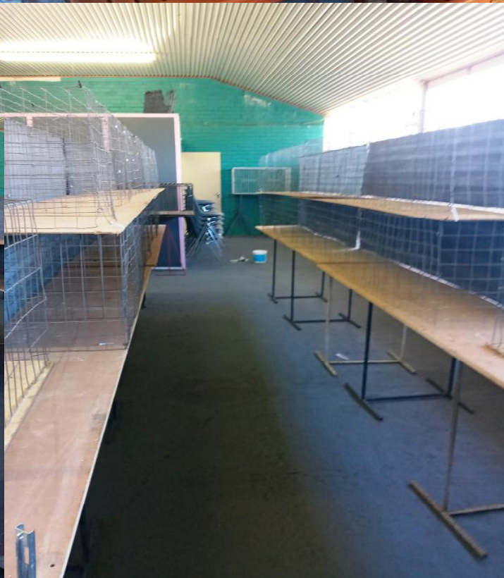
The Fancy Pigeon