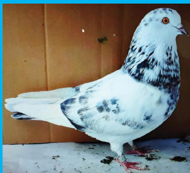
The Fancy Pigeon