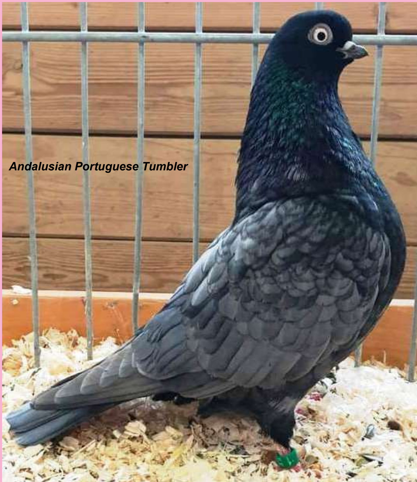
Andalusian Portuguese Tumbler