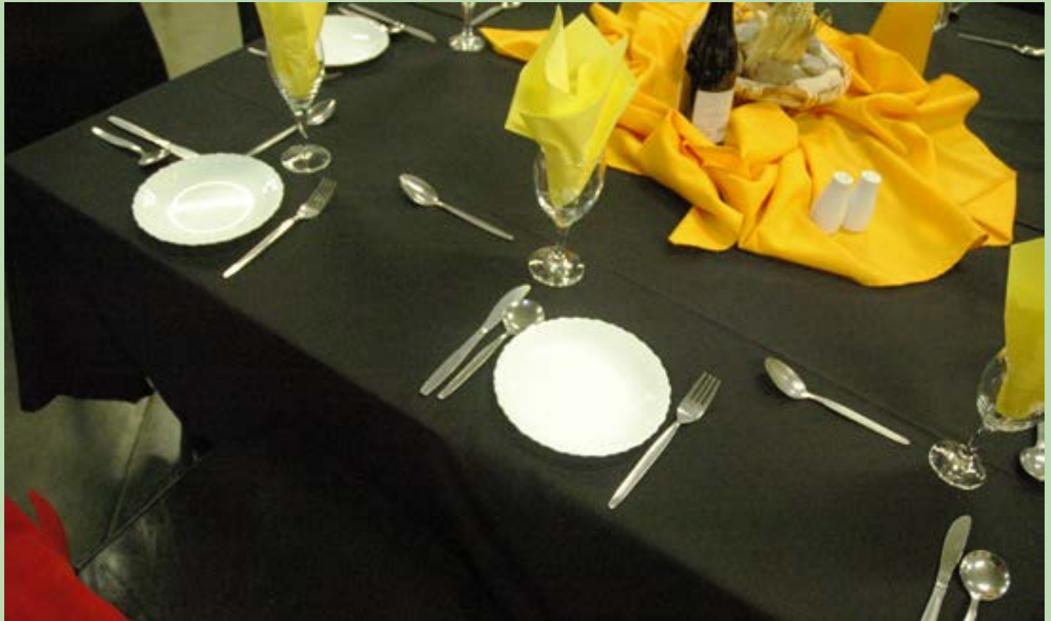
Bo Tafel versiering tydens die onthaal